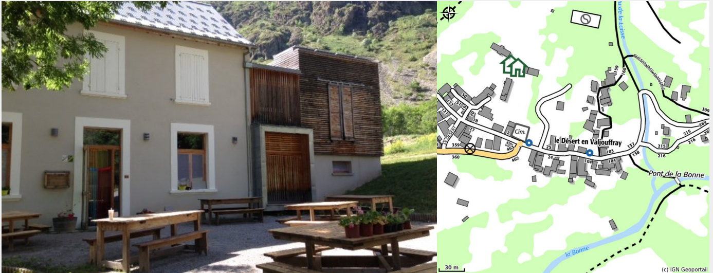
Vue du gîte extérieure, entrée et terrasse