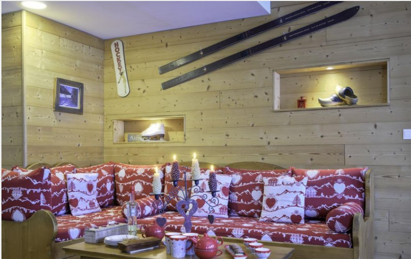
Crédit photo : Grand canapé avec un lit gigogne 1 place (Gîtes de France)