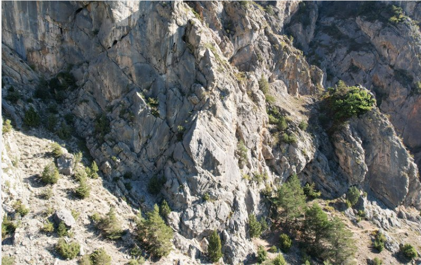
(nicolas Bianchi @Parc national des Ecrins)