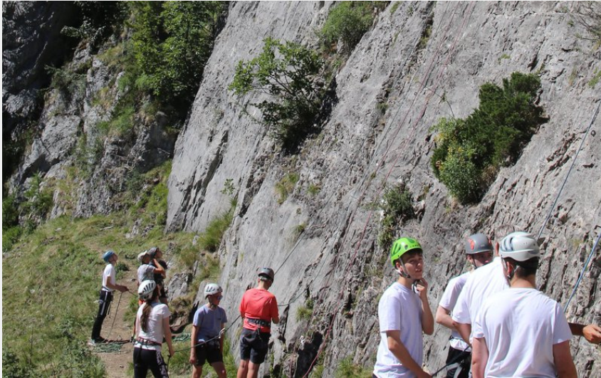
Falaise des Orres