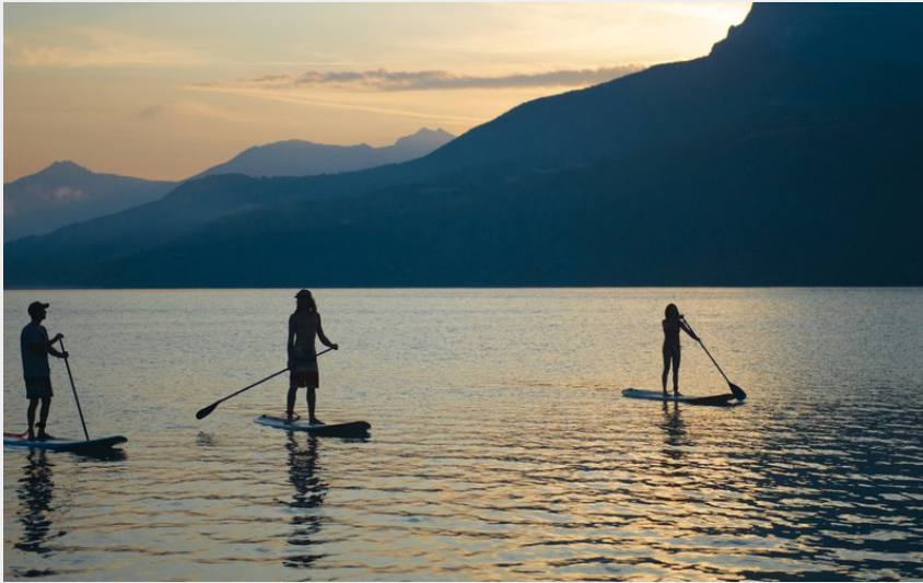
Vue sur le sommet du Morgon (Le Naturographe)