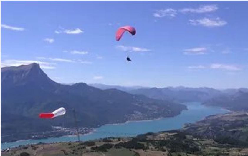
Décollage du Mont Guillaume (Bernard Keller)