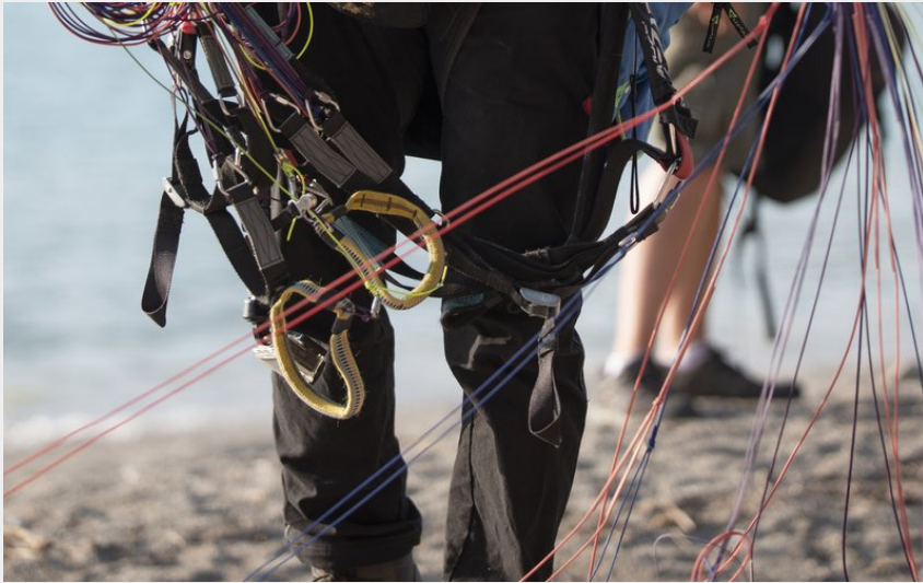
Il est temps de replier la voile (LeNaturgraphe)