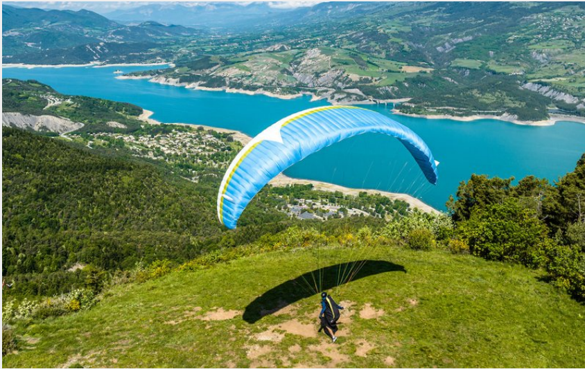
Décollage de Pierre Arnoux