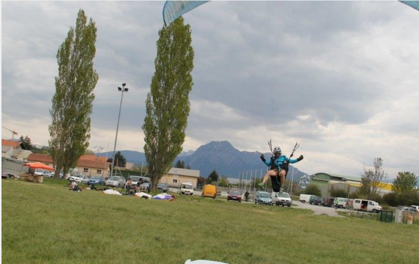
Atterrissage lors de la compétition d'atterrissage de précision