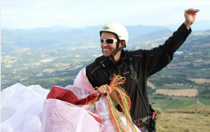
Les dernières préparations avant le décollage (Mairie de Chorges)