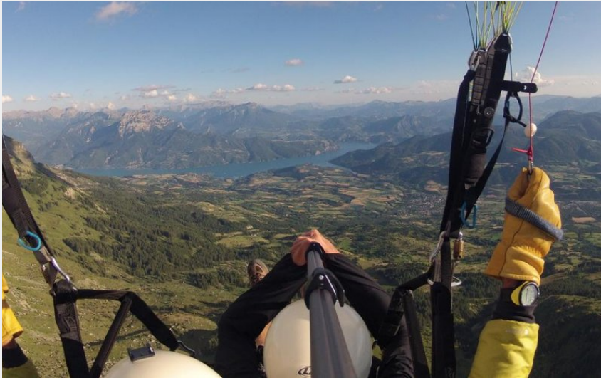
Biplace au dessus de la montagne de Chorges