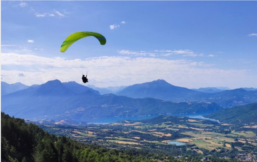
Panorama depuis les hauteurs de Serre Michel