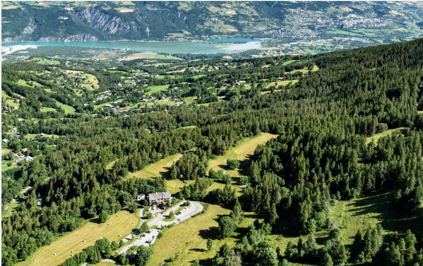
La Draye et le Mont Guillaume en toile de fond