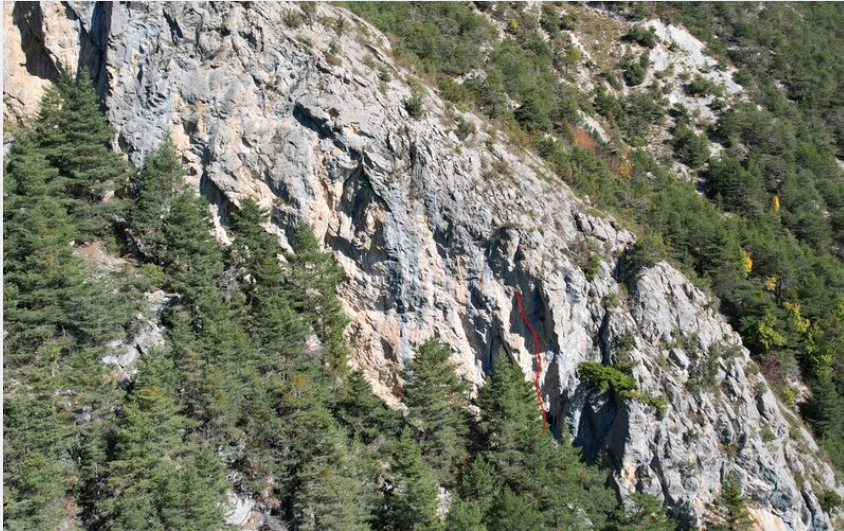
(Nicolas Bianchi - Parc national des Ecrins)