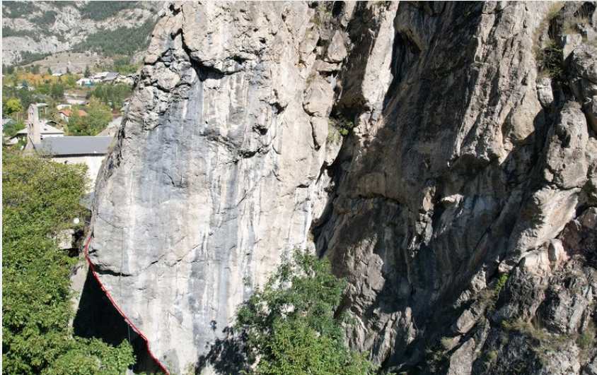
(Nicolas Bianchi - Parc national des Ecrins)