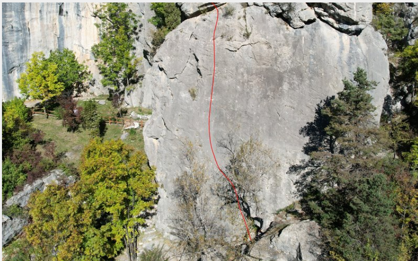
(Nicolas Bianchi - Parc national des Ecrins)