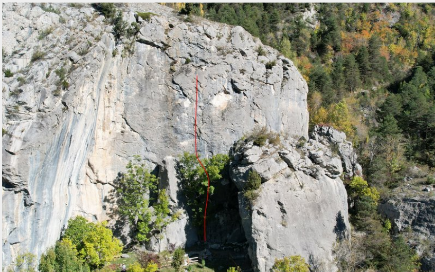
(Nicolas Bianchi - Parc national des Ecrins)