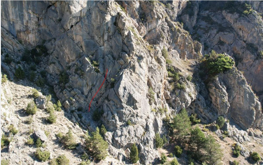
(Nicolas Bianchi - Parc national des Ecrins)