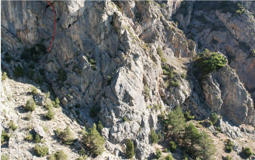
(Nicolas Bianchi - Parc national des Ecrins)