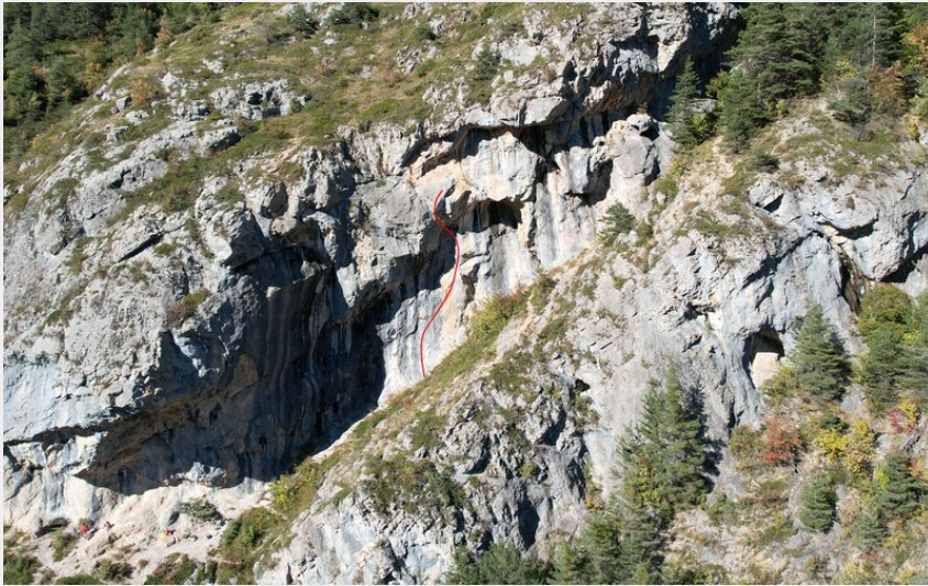
(Nicolas Bianchi - Parc national des Ecrins)