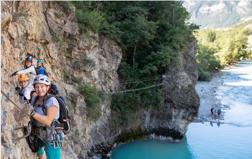
Via Ferrata Gorges de la Durance Noire (Thibaut Blais)