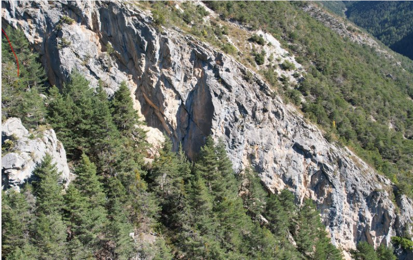
La censure vieille (Paroi du Villars) (Nicolas Bianchi - Parc national des Ecrins)