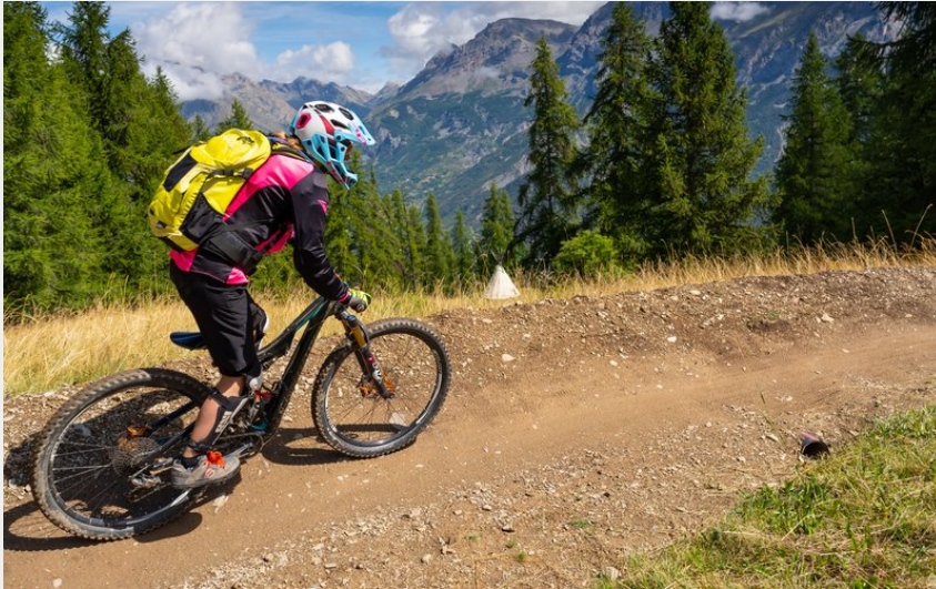
Traversouille (Rogier van Rijn)