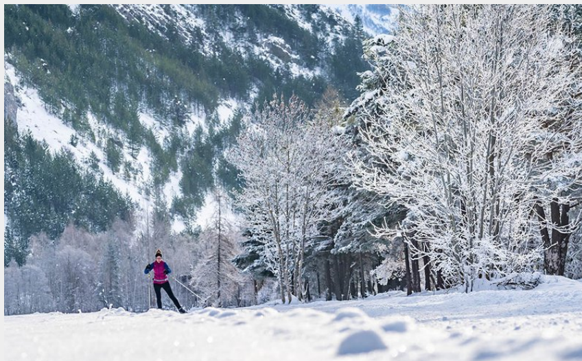
La Plaine de Vallouise (Rogier Van Rijn)