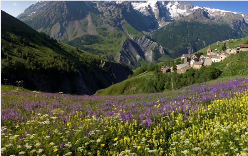
Hameau des Hières