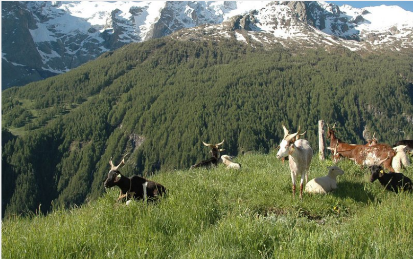
Troupeau face à la Meije