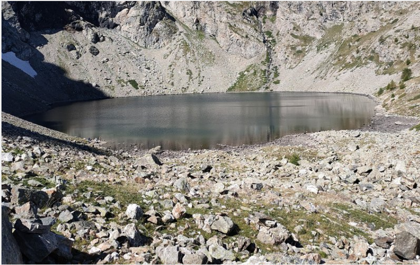
L'arrivée au lac de Puy Vachier (Elodie LEFEVBRE)