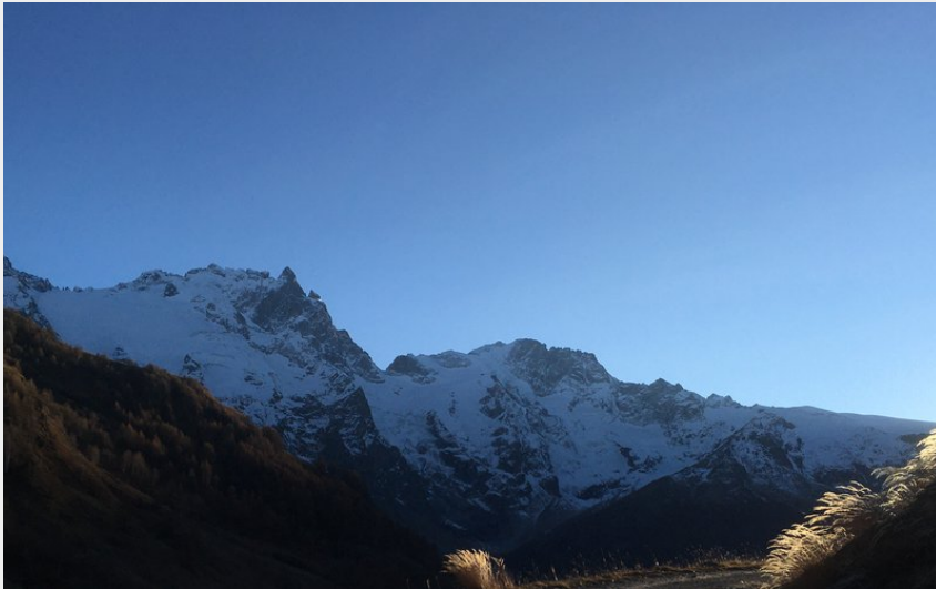
Route de Valfroide en novembre