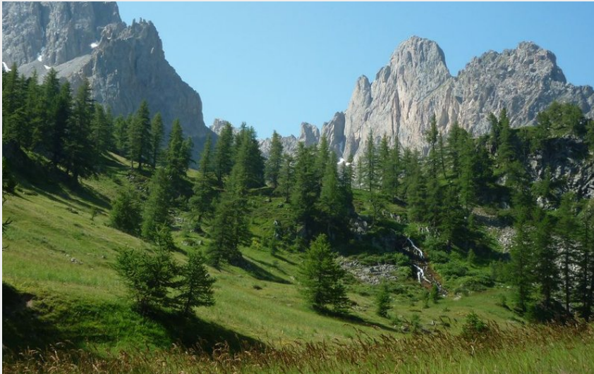
Le Chardonnet