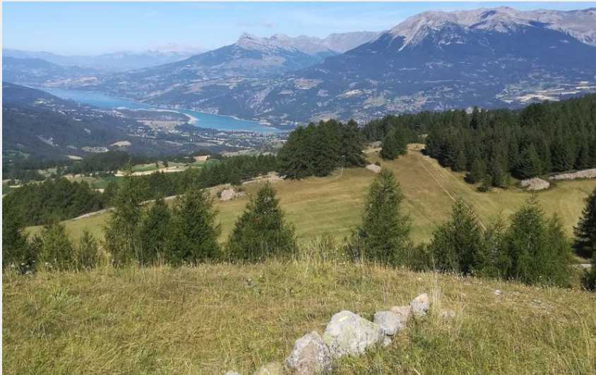
Vue sur le Lac de Serre-Ponçon au pied du Méale (Amélie Vallier)