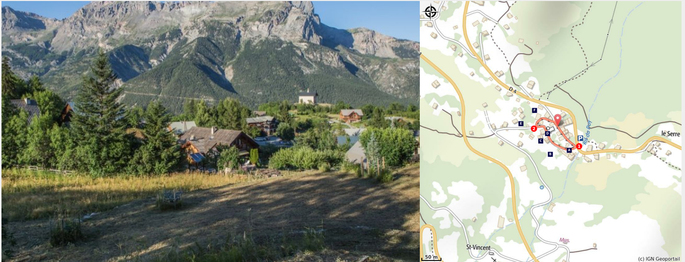
Puy St Vincent

The local inhabitants are called the "Traversourirres" because their houses are built in a series of small hamlets perched on the slope and the streets on the side of the "puy" (mountain). Here people say you "traverse" ("cross") to go from one hamlet to the next.