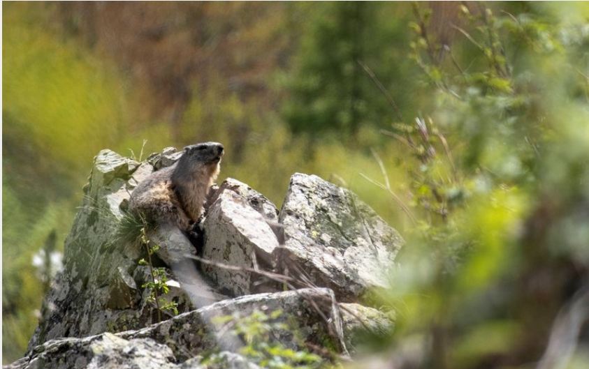
Attribution : Marmotte sur son rocher (Mireille Coulon, Parc des national des Écrins)