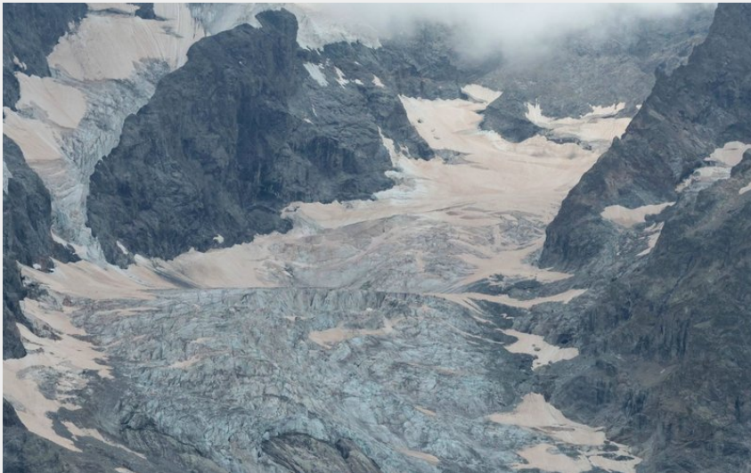
Attribution : glacier de l'Homme (Marc Corail, Parc national des Ecrins.)